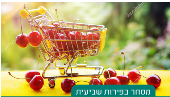
מסחר בפירות שביעית