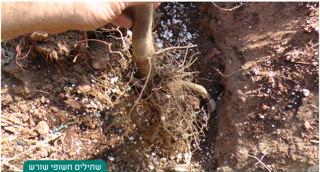
שתילים חשופי שורש

עצי פרי המושרשים בתוך גוש הנמצא בעציץ נקוב (קוטר הנקב בתחתית גדול מ-2.5 ס"מ) קודם ט"ו באב ועמדו על הקרקע מלפני כ"ט באב (כך שנחשבים כמחוברים לקרקע), אפשר לנטועם עד ערב ראש השנה בתנאי שגוש השורשים לא יתפורר בשעת השתילה.