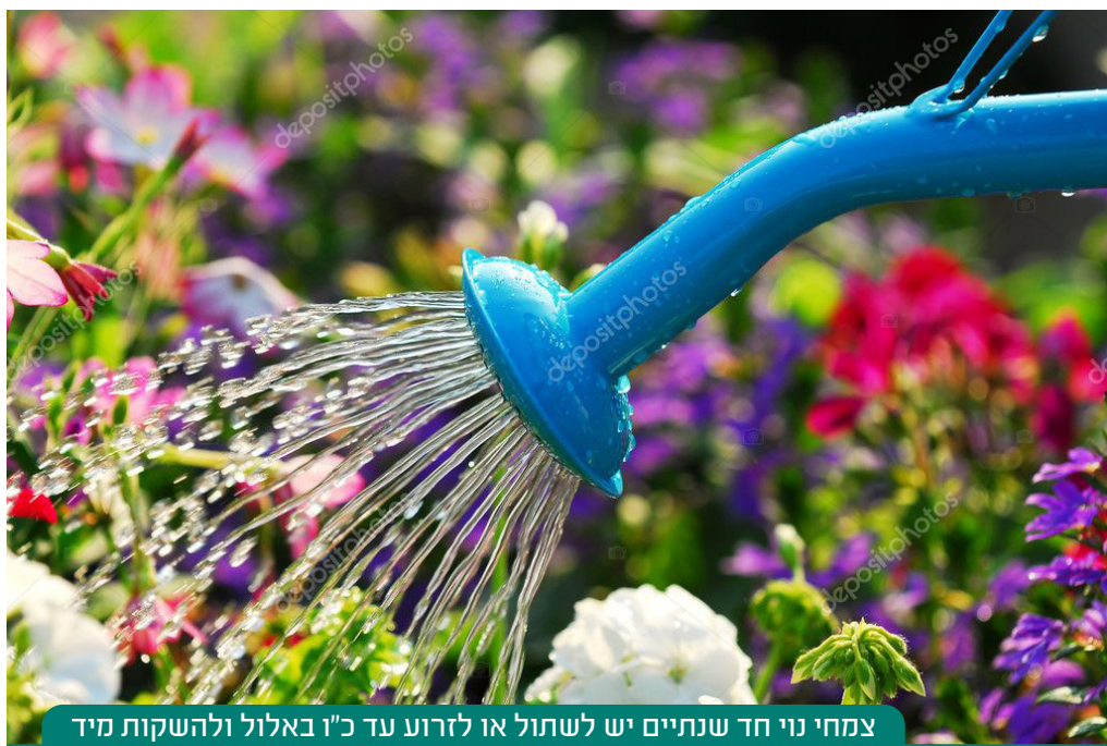
צמחי נוי חד שנתיים יש לשתול או לזרוע עד כ"ז באלול ולהשקות מיד

3. שתילי עצי סרק וצמחי נוי רב שנתיים שאין בהם דין ערלה והם גלויי שורש או כשיש חשש להתפוררות גוש השורשים בשעת השתילה - מותר לשתול עד ט"ז באלול (אסור להשקות צמחים אחר ראש השנה כדי שישתמשו אם לא השתמשו עד אז). צמחי נוי חד שנתיים יש לשתול או לזרוע עד כ"ז באלול ולהשקות מיד.