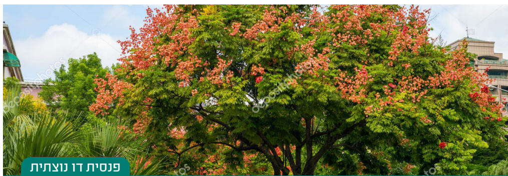
פנסית דו נוצתית