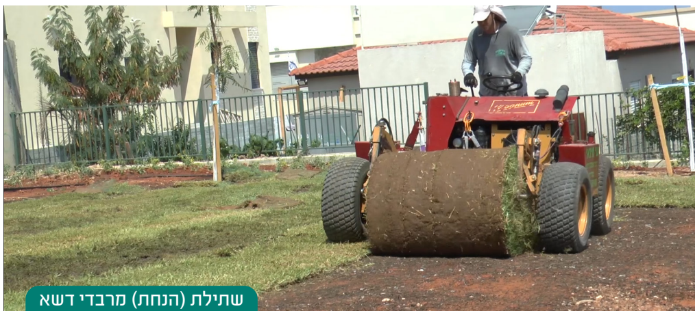
שתילת (הנחת) מרבדי דשא

גם צמחים אחרים, כגון: עצים, שיחים, ורדים, פרחים רב שנתיים וכיו"ב, כדאי להקדים את שתילתם כדי שיצמחו ויתבגרו ככל האפשר בשנה השישית. ככל שהצמח מבוגר יותר הוא זקוק לפחות טיפולי עיצוב, גיזום, דישון ועישוב.