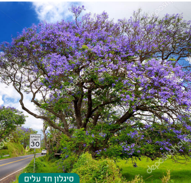
סיגלון חד עלים

2. עצים נשירים "מאולצים" שאינם נושרים בארצות מוצאם החמות יותר ונושרים אצלנו בחורף הקר יחסית, כגון: סיסם הודי, צאלון נאה, מכנף נאה, סיגלון חד עלים, שלטית מקומטת (פלטופורום), אלביציה צהובה וכדו', ייגזמו בתחילת הקיץ של השנה השישית. גם עצים תדירי ירק כגון: מיני פיקוס, אלון מצוי, אדר סורי, זית וכדו', ייגזמו כנ"ל. אם לא