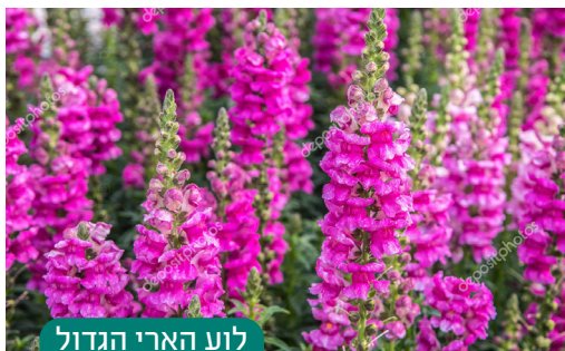
לוע הארי הגדול

6 במקום פרחי עונה שנהוג לשתול בכמות גדולה לקבלת אפקטים של צבע אפשר לשתול לפני השמיטה פרחים רב שנתיים , אשר יצמחו ויפרחו במשך שנת השמיטה. לדוגמא: מיני גרניום (פלרגון), לוע הארי הגדול, גזניה, חרצית, אריאופסיס, מיני מרווה, דגניים רב שנתיים ועוד רבים אחרים.